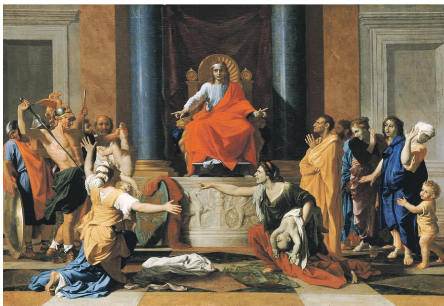
Le Jugement de Salomon , huile sur toile (101x150 cm), 1649, par Nicolas Poussin (1594–1665), musée du Louvre.